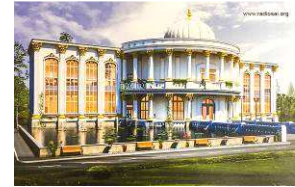
Maquette du Centre de Congrès International

Situé au sud de l'ashram, près du Book Trust , ce Centre de Congrès International comprendra deux salles de congrès, l'une de 1.000 places et l'autre de 300 places, destinées aux groupes de fidèles indiens et étrangers afin de leur faciliter l'organisation de programmes, de spectacles, de réunions et de conventions sur des sujets spirituels. Le bâtiment devrait être achevé dans 18 mois, bien avant le 95 e anniversaire de Bhagavān Śrī Sathya Sai Baba.